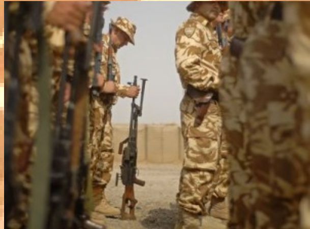
Britští vojáci

Britská okupace Basry však byla považována za úspěšnější než americká okupace Bagdádu. Britové, někdejší kolonizátoři, mají bohaté zkušenosti se správou cizích území, proto se nejspíš v Iráku nedopustili tolika přehmatů jako Američané. Nyní je Basra, kde působili také čeští vojenští policisté, na irácké poměry bezpečným místem.