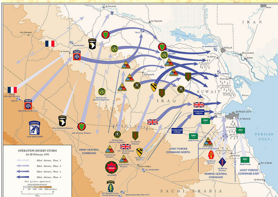
Schéma operace Pouštní bouře