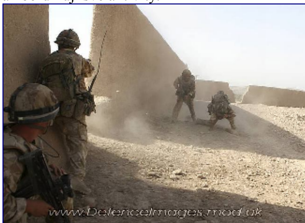
3 Para během operace Oqab Tsuka v Afghánistánu

Vedle ISAF působí v zemi i koaliční protiteroristická operace Trvalá svoboda (Operation Enduring Freedom, OEF) pod vedením USA. Jejím úkolem je aktivní boj s teroristy především na jihu a východě země podél hranic s Pákistánem. ISAF a OEF úzce spolupracují a koordinují své aktivity.