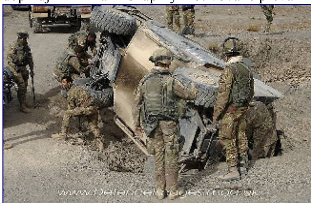
Italský Pancéřovaný Personální Nosič (APC), který je součástí prozatímního rekonstrukčního týmu (PRT) v provincii Herat, Afghánistán.

Největší část opozičních militantních sil , které bojují proti afghánské vládě a mezinárodním jednotkám v Afghánistánu, je tvořena náboženským fundamentalistickým hnutím Taliban , který ovládal zemi před intervencí mezinárodního společenství v říjnu 2001. Jeho tvrdé jádro je relativně malé, avšak disponuje značnými prostředky k najímání dostatečného počtu bojovníků. Jeho základnou je afghánský jih a sousedící oblasti pákistánského Balúčistánu. Taliban spolupracuje s Al Kajdou , která poskytuje především technickou asistenci a sofistikované vybavení. Zejm. na východě Afghánistánu operují menší extremistické skupiny, jako jsou „Hezb-e Islami Gulbuddin“ či „Haqqani network“. Mozaiku doplňují kriminální skupiny motivované převážně finančními zisky.