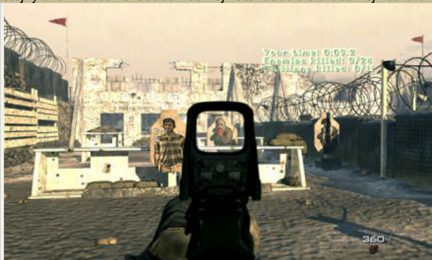
Úroveň The Pitt ve hře Call of Duty: Modern Warfare 2.

Tvůrci magazínu se rozhodli vyzkoušet, jaký je rozdíl mezi hrou a realitou. Zatímco hráč se pokusil co nejrychleji zdolat virtuální trať, voják elitních jednotek SAS absolvoval tu reálnou. Oba měli stejný úkol – absolvovat trať v co nejkratší době a trefit co nejvíce cílů.