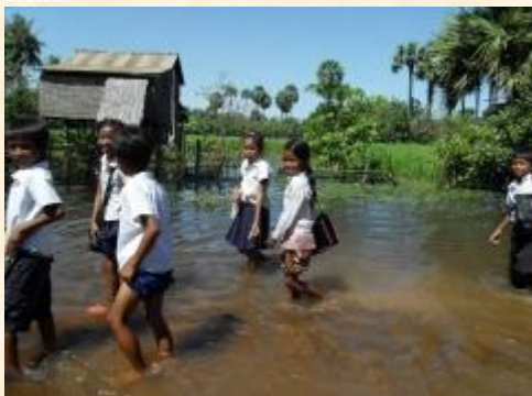
Děti z vesnice Thmor Keo jdou ze školy domů na oběd

V provincii Kampong Chhnang, kde nyní Člověk v tísni pomáhá lidem, zasaženým povodněmi, organizace pracuje od roku 2010. Ve spolupráci s dvěma místními neziskovými organizacemi se snaží podpořit chudé obyvatelstvo venkova v jejich způsobech obživy – v pěstování zeleniny, chovu drůbeže, žab a ryb či ve zpracovávání místních produktů. Projekt zahrnuje 21 vesnic, z nichž několik bylo také silně zasaženo povodněmi. Lidé museli opustit své domovy a postavit si dočasné přístřešky v bezpečné vzdálenosti od vody. Spousta z nich přišla o svá drobná hospodářství, která pro ně byla často jediným zdrojem pravidelného příjmu.