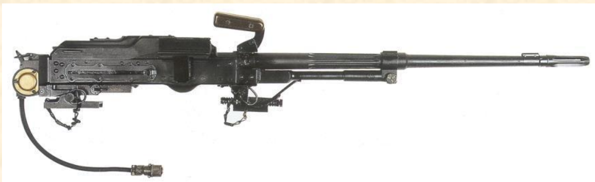
Obr.: 7,62 mm tankový kulomet PKT