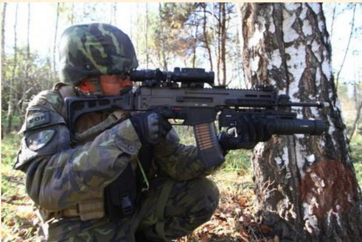
Autor: major Martin Hajduch, tiskový a informační důstojník 4. OMLT, Olga Haladová Zdroj: www.army.cz

Foto by SIGNALCORPS pořizeno na akci Útok na FOY 2011 http://signalcorps.rajce.idnes.cz/