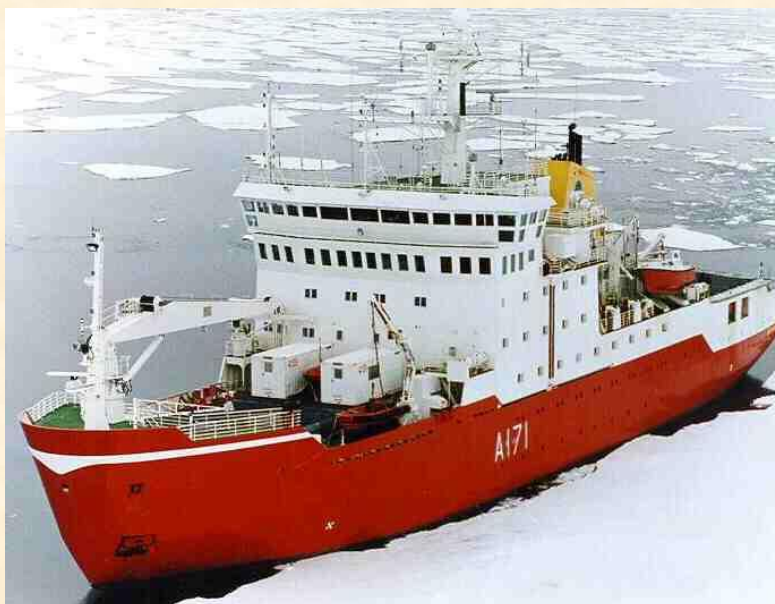
HMS Endurance – hlídkový ledoborec, jehož funkcí je podpora britských zájmů v antarktických vodách, hlavně v okolí Antarktického poloostrova.

Předehrou války se stalo vylovení 50 příslušníků argentinského námořnictva (vydávali za obchodníky z kovovými odpady) na britský ostrov Jižní Georgia, kde se nacházel pouze tým britských vědců, a vztyčili zde vlajku Argentiny . Po této události obdrželi vojáci Královské námořní pěchoty z lodi Endurance rozkaz, aby na ostrově zajistili svou vojenskou přítomností ochranu vědeckého týmu a pozorovali Argentince. 1100 kilometrů na severozápad na Východních Falklandách byla také v britské vojenské posádce vyhlášena pohotovost. V té době čítala posádka 60 mužů, což byl její dvojnásobný početní stav, který byl zapříčiněn střídáním posádek.