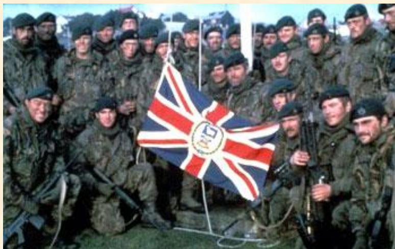
Členové Royal Marines Commando

okolní skupiny ostrovů kolem South Georgia a South Sandwich. Koncem dubna měla Argentina na Falklandech více než 10 000 vojáků, i když se jednalo převážně o špatně trénované brance.